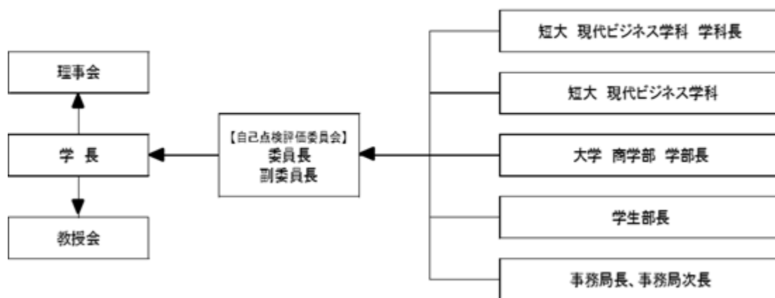
自己点検評価委員会の組織図